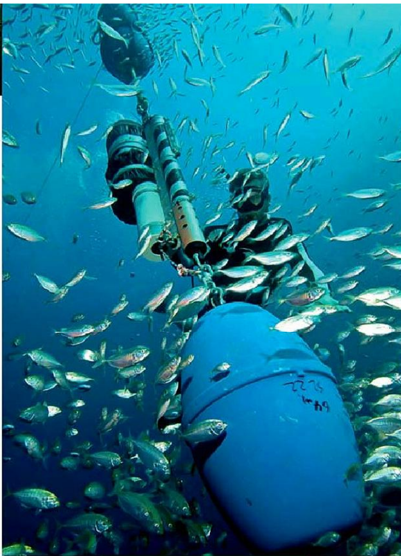
ROB HAN/OUR COMMON INTERESTS UNIVERSITY 2012 FROM THE HUMAN FACE OF BIG DATA