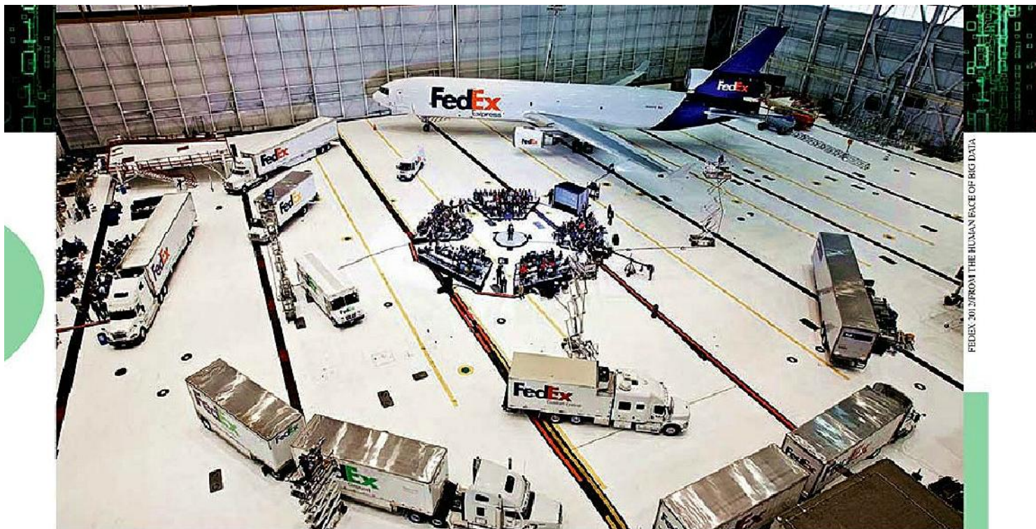
FEDEx 301 FROM THE HUMAN FACE OF BIG DATA

N a tarde de 6 de maio de 2010, o mercado financeiro em Nova York começou a despencar. O índice Dow Jones, que mede o desempenho das ações das trinta maiores empresas americanas, entrou em queda livre sem que ninguém entendesse a razão. Eram 14h42. Raramente o Dow Jones oscila mais de 300 pontos durante um dia inteiro. Naquela tarde, às 14h47, apenas cinco minutos depois do começo da queda, o índice já havia desabado 700 pontos, deflagrando uma onda de pânico entre investidores. Era então, e ainda hoje o é, a maior queda da história em tão pouco tempo. Quase 1 trilhão de dólares viraram pó em questão de segundos. De repente, sem razão aparente, o índice voltou a subir — furiosamente. Em um minuto, o Dow Jones estava no patamar normal. O caso ficou conhecido como o crash-relâmpago da Bolsa de Nova York.